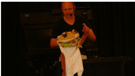
In den rappenden Döner wurde nur kurz reingebissen. Dann flog er in die Tonne!