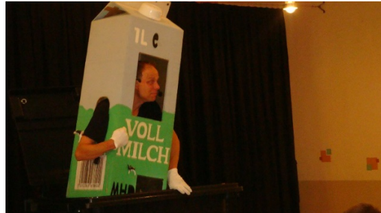
Die sprechende Milchtüte berichtete von Kuh Bella und vom Abfalldatum.