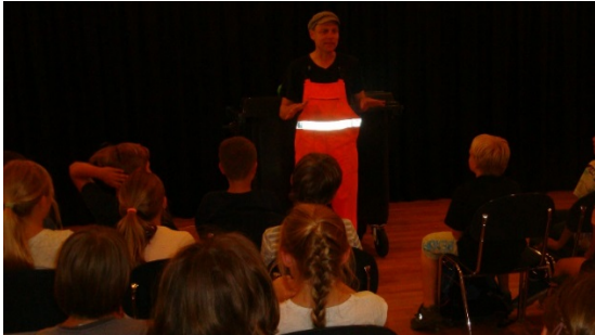
Herr Stinknicht- der Müllmann.

Wir erfuhren auch Wissenswertes über das Abfalldatum.